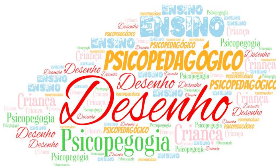
Figura 2. Nuvem de palavras a partir dos títulos dos artigos pesquisados e depositados na plataforma Google Acadêmico no período de 2017 – 2021.

Nota-se regularidade em publicações nos anos de 2017, 2018 e 2020, excetuando o pico de produção em 2019. Por outro lado, no ano de 2021 apenas uma publicação fez parte do corpus , ainda que não se refere a tendência de queda, ora por constar de apenas cinco meses do ano, ora por não considerar mais que dez manuscritos por rodada de busca. Observa-se na Figura 2 as palavras recorrentes nos títulos dos manuscritos pesquisados.