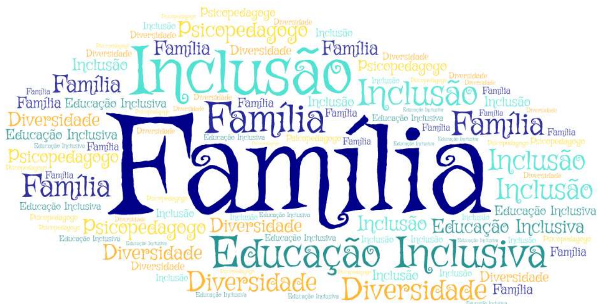
Figura 2 – Nuvens de palavras originárias a partir dos títulos dos artigos selecionados e indexados ao Google Acadêmico , considerando o período de 2017-2021.

Demonstram-se na Figura 2 os termos recorrentes nos títulos dos artigos que formaram a base para categorização temática supradita, bem como para seleção randomizada e análise interpretativa.