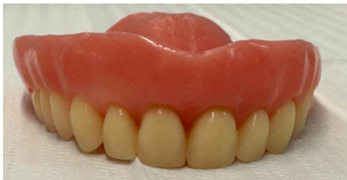
Legenda figura 6: Prótese total superior pronta para entrega.