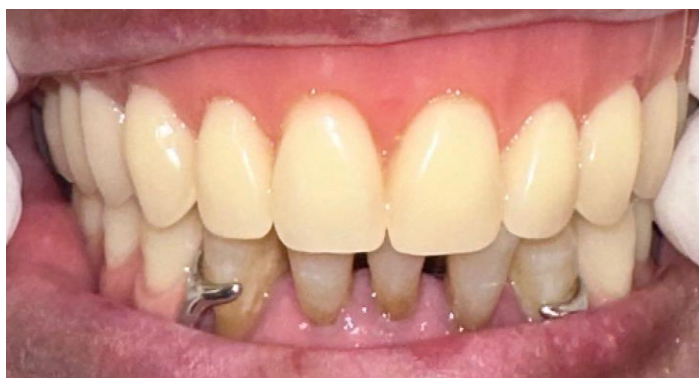
Legenda figura 7: Paciente utilizando a prótese total superior e a prótese parcial removível inferior