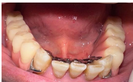
Legenda figura 8: Prótese parcial removível inferior