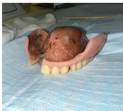
Legenda figura 2: Prótese total superior antiga fraturada e pigmentada