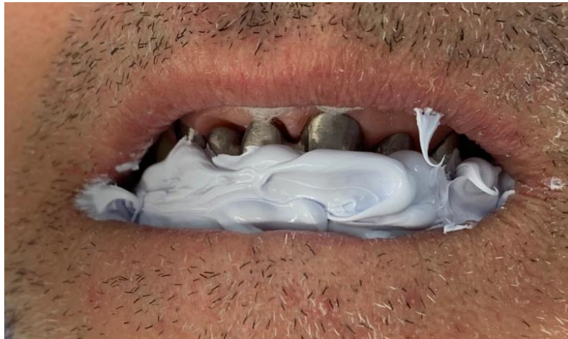
Figura 11: Registro de mordida com Silicone de Adição para Registro de Mordidas Scan Bite