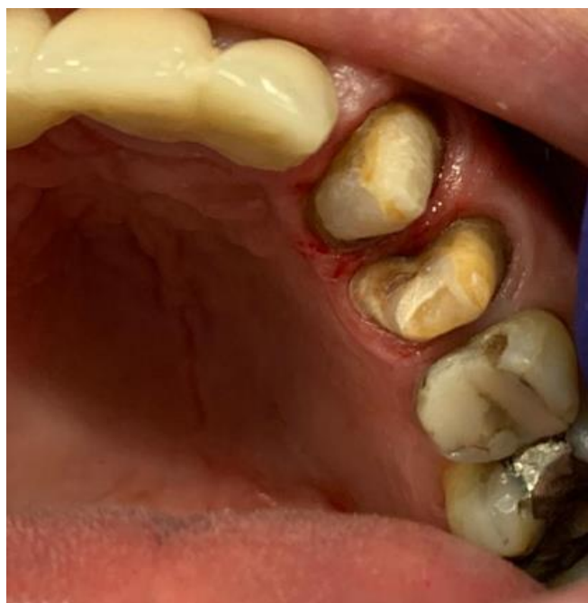
Figura 3: Dente 25 apresentando lesão de cárie