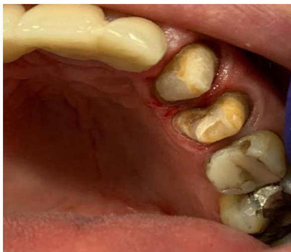
Figura 2: Preparo dos elementos 23 e 24