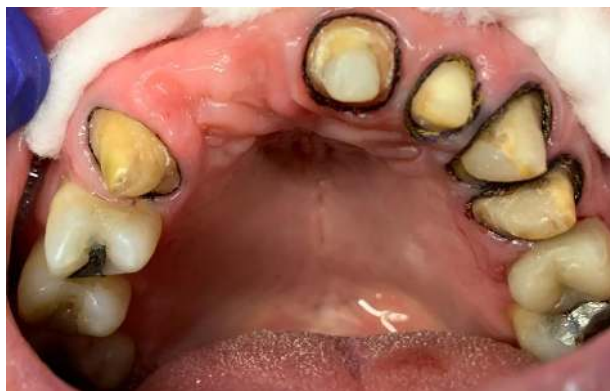
Figura 6: Registro dos preparos com fio retrator para moldagem

Após retorno do laboratório, foi realizado a remoção dos provisórios e limpeza dos preparos, prova do encerramento e da estrutura metálica e ajustes da oclusão. Novo registro de mordida, escolha da cor, A2 corpo e A3 cervical figura 12, realizado registro fotográfico para encaminhar junto ao laboratório e recimentação dos provisórios com dycal e encaminhado novamente ao laboratório para aplicação da cerâmica.