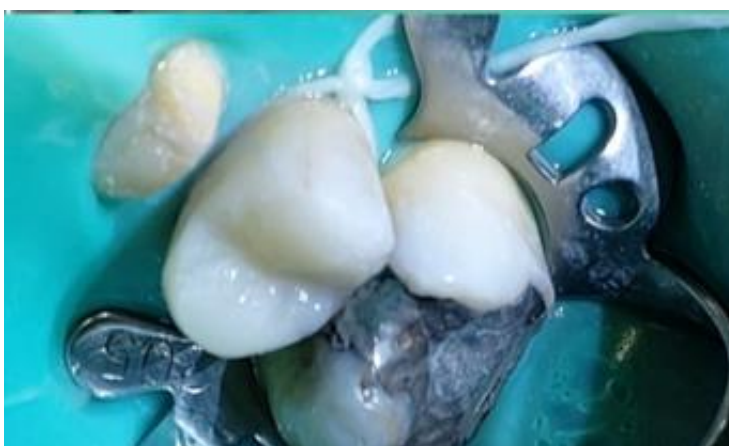
Figura 5: Dente 25 restaurado

A consulta seguinte foi destinada para moldagem do arco antagonista, registro de mordida e montagem do arco facial, para que na próxima consulta, fosse realizado a remoção dos provisórios do 13 ao 24, profilaxia com pasta profilática para remoção e limpeza dos excessos de cimento provisório, inserção do fio retratador número #000 e #00, moldagem com silicone de adição densa e leve com a moldeira S3. O registro de mordida foi feito com silicone de adição Scan Bite – Yller e encaminhado ao laboratório para confecção dos casquetes metálicos para coroas metalocerâmicas, além disso foi solicitado também o encerramento impresso para prova e melhor conferência da adaptação.