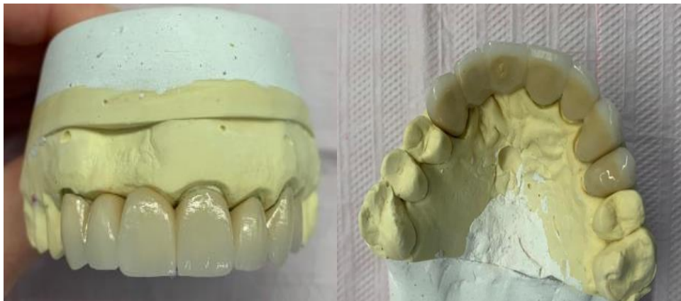
Figuras 13 e 14: Cerâmicas prontas para cimentação

Com o retorno do laboratório, foi realizada a prova das coroas e a cimentação das cerâmicas com cimento resinoso Dual RelyX™ U200.