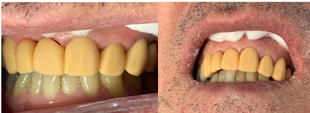
Figuras 7, 8 e 9: Prova do enceramento impresso