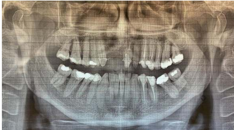
Figura 1: Imagem da Radiografia Panorâmica da paciente