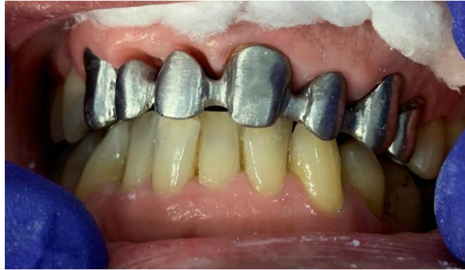
Figura 10: Prova da Estrutura metálica