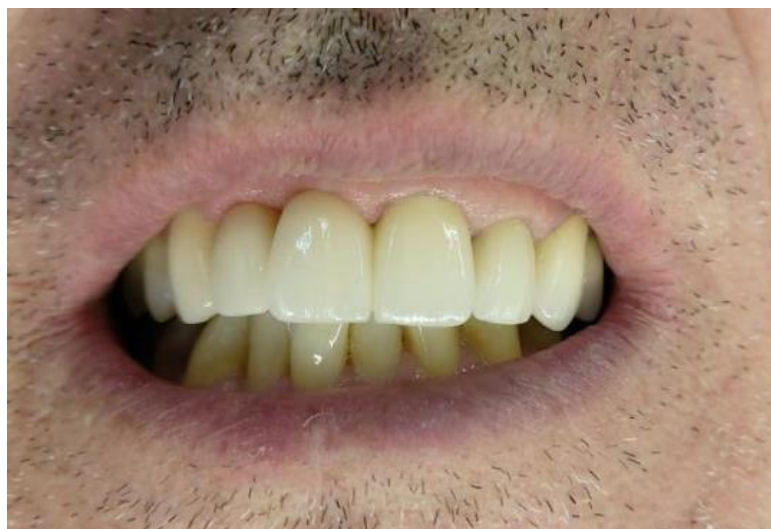
Figura 15: Coroas Cimentadas