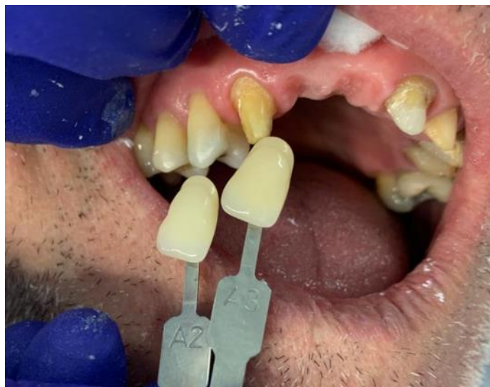
Figura 12: Escolha da cor