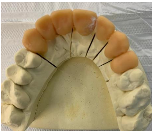
Figuras 7, 8 e 9: Prova do enceramento impresso

Após retorno do laboratório, foi realizado a remoção dos provisórios e limpeza dos preparos, prova do encerramento e da estrutura metálica e ajustes da oclusão. Novo registro de mordida, escolha da cor, A2 corpo e A3 cervical figura 12, realizado registro fotográfico para encaminhar junto ao laboratório e recimentação dos provisórios com dycal e encaminhado novamente ao laboratório para aplicação da cerâmica.