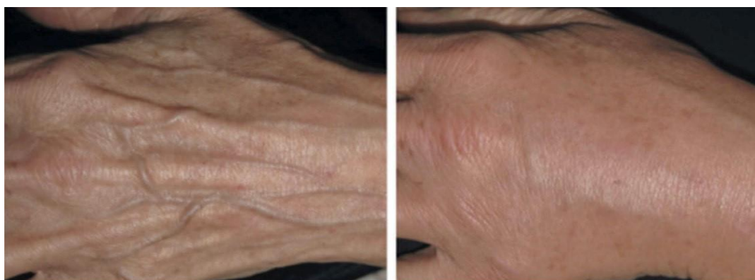
Figura 3: Efeito após o tratamento com policaprolactona nas mãos

Fonte: (Imagem extraída de: Lowe; Ghanem, 2020) 29