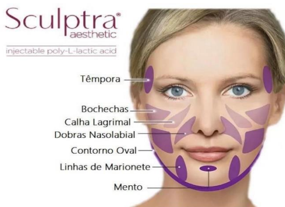
Figura 2: Áreas de aplicação do ácido poli-L-lático - Sculptra®

27