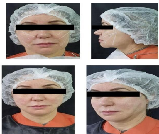
Figura 4: Resultado do antes e depois de uma paciente a qual realizou o procedimento com fios de PDO