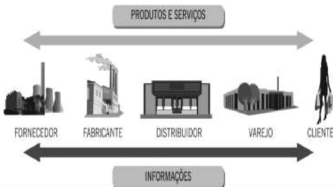
Figura 1 - Representação da cadeia de suprimentos Fonte: (PLATT, A.A., 2015)

Segundo Gonzales (2019), o gerenciamento de materiais de construção e suprimentos de forma geral, é uma tarefa complicada, complexa e de suma importância para qualquer canteiro de obras. Afinal, uma empresa não pode realizar suas obras sem os insumos e prestadores de serviços com a qualidade exigida, no tempo certo e na quantidade correta. Erros de administração nessa área culminam em um fracasso do empreendimento. Por isso, a melhor resposta para evitar esses problemas está em um sistema automatizado de gestão.