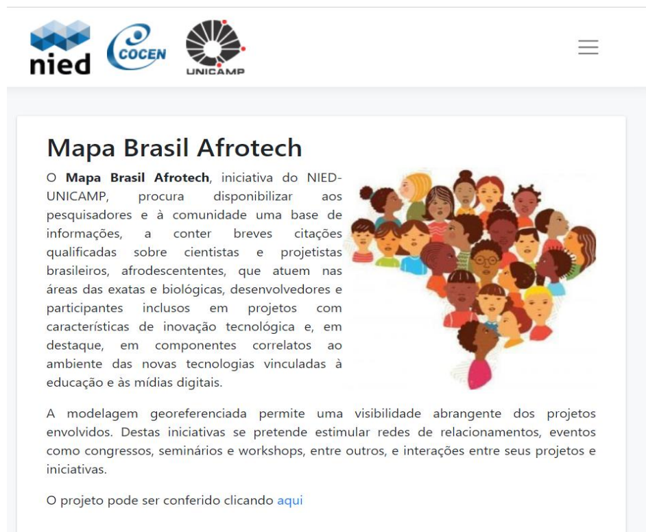
Figura 1 - Tela de apresentação do projeto

Conforme objetivo descrito em seu site , inserido em plataforma, o projeto denominado Mapa Brasil Afrotech (Figura 1) se desenvolve em virtude de atender a esse conjunto de demandas em informações qualificadas e consideradas ausentes em outras mídias.