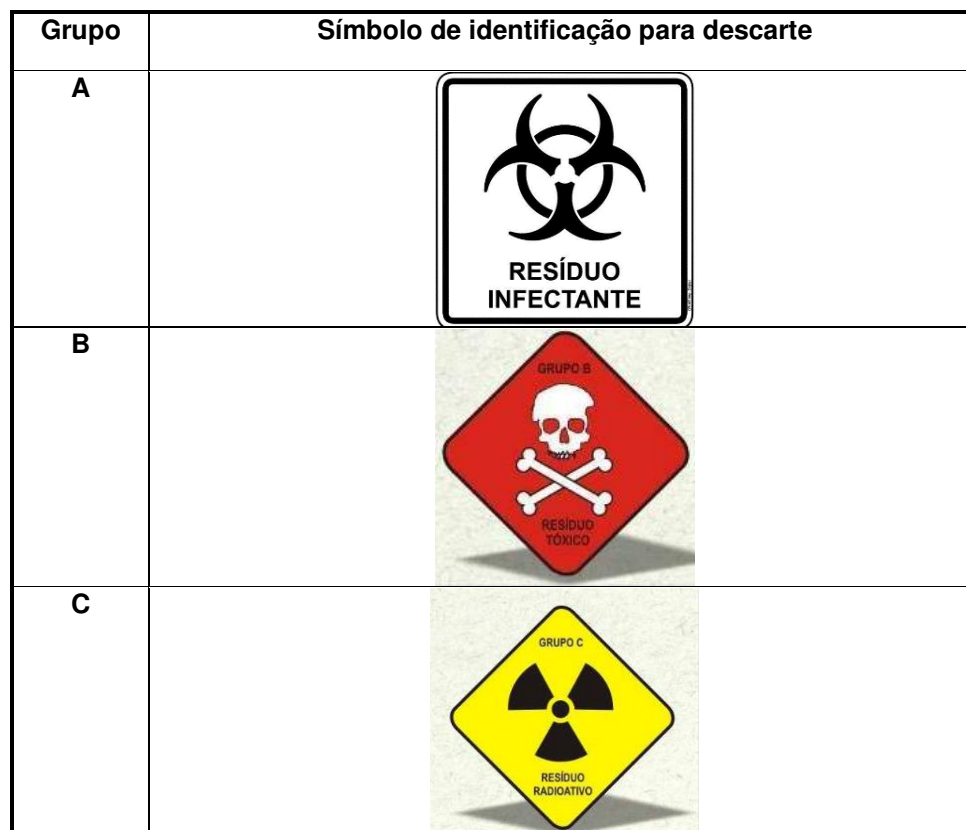
Tabela 2– Principais símbolos para a identificação e descarte de resíduos

Assim como a coleta devida, a identificação desses resíduos é essencial, então, deve ser identificado na embalagem durante o seu descarte (Brasil, 2004), como observado nas imagens do quadro abaixo.