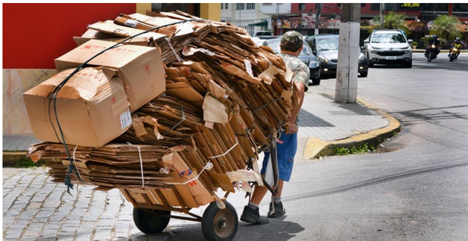
Figura 1 –Catador de reciclagem

Outro aspecto importante é o papel dos catadores de materiais recicláveis (Figura 1), que são uma parte essencial da cadeia de reciclagem no Brasil sendo apontado como pela reciclagem de 90% dos resíduos gerados (Barros, 2022). Apesar de sua contribuição na recuperação de materiais úteis, esses trabalhadores enfrentam condições precárias e falta de reconhecimento. A inclusão social e econômica dos catadores é fundamental para uma gestão mais eficiente dos resíduos e para reduzir a quantidade de lixo destinada a aterros sanitários (Pisano et al. , 2022).