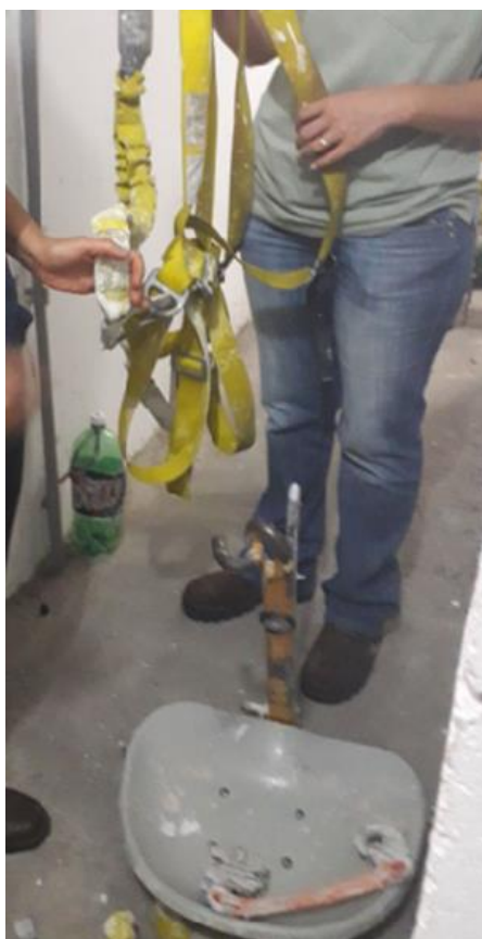
Figura 2 - Cinto para trabalhar suspenso: Fonte: (AUTOR, 2023)

Na figura 2 é possível observar a inspeção em um cinto de segurança usado para trabalho suspenso.