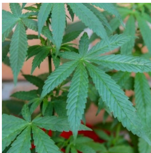
Figura 2: Cannabis sativa .

Os efeitos psicotrópicos e de comportamento próprios da planta são atribuídos ao conteúdo dessa classe de compostos, os canabinóides, principalmente o THC, que está presente nas folhas e botões florais da planta, principalmente. Existem ainda outros canabinóides que não possuem capacidades psicoativas, mas apresentam diversas funções medicinais, como o canabidiol (CBD), o (CBC) e o canabigerol (CBG) 11 . O THC é o composto psicoativo principal presente na maconha. O CBD, de forma oposta, não possui efeito psicoativo, não possuindo uma sensação de alta e em vez disso, pode neutralizar alguns efeitos colaterais do THC (BONINI et al. , 2018).