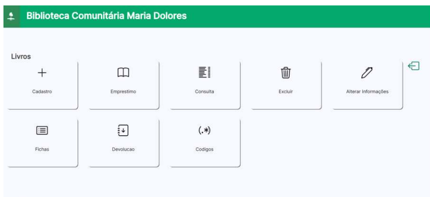
Figura 2 – Tela de funcionalidades do Sistema de Gerenciamento