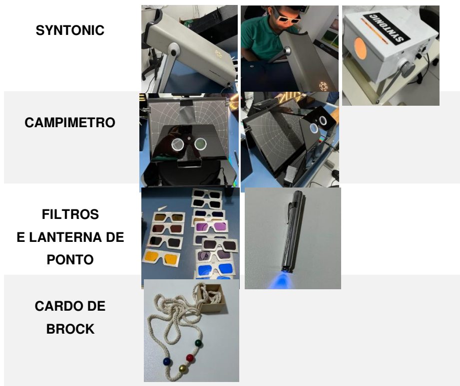
Figura 2 – Demonstra os tipos de instrumentos e equipamentos aplicados na fototerapia

FOTOTERAPIA REABILITATIVA: CONDUTA OPTOMÉTRICA Leandro Medeiros da Costa, Rodrigo Trentin Sonoda