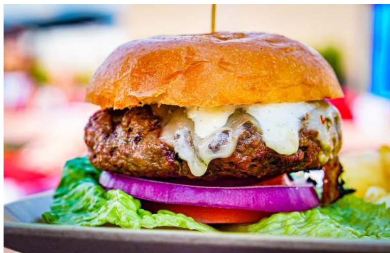
Figura 1. Hambúrguer Plant-based