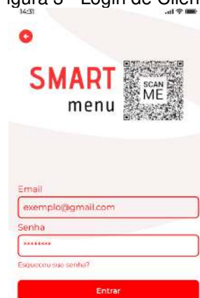
Figura 3 - Login de Cliente

Caso seja um cliente, ao clicar no botão Cliente, este será redirecionado à página de login do cliente (Figura 3), e do cadastro caso ele não seja cadastrado (Figura 4). E, posteriormente a isso, ele obterá o cardápio de ofertas o qual ele terá acesso a seguir.