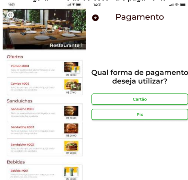
Figura 7 - Telas de escolha e pagamento

SMART MENU: PROTÓTIPO DE APLICATIVO PARA GERENCIAMENTO DIGITAL DE CARDÁRIOS Marcelo Henrique Mesquita da Silva, Alysson Filgueira Milanez