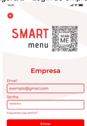
Figura 2 - Login de empresa