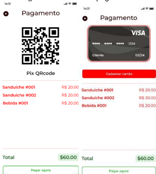
Figura 9 - Formas de pagamento

Caso o cliente opte pelo Pix, será gerado QRCode para que ele possa escanear e realizar o pagamento. Caso tenha escolhido o pagamento em cartão, será redirecionado à página de preenchimento de dados do cartão, conforme a Figura 9.