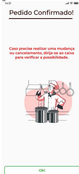
Figura 10 - Pedido confirmado

Após o pagamento, o pedido do cliente é confirmado (Figura 10), e, caso ocorra alguma eventualidade, é necessário que o cliente se dirija ao caixa.