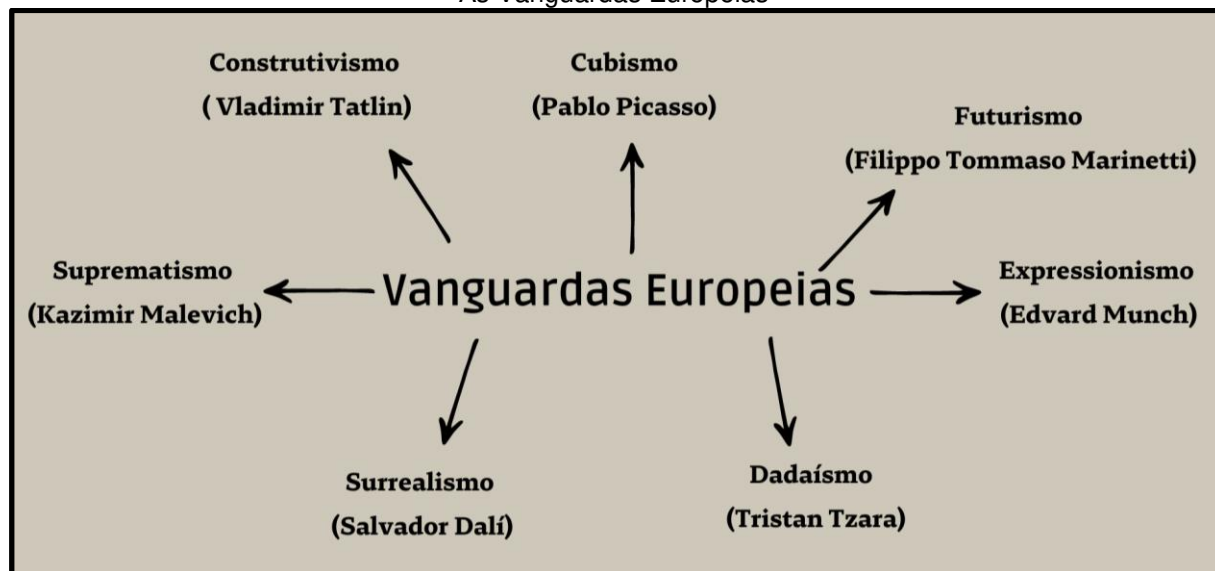
Figura 1: Às Vanguardas Europeias