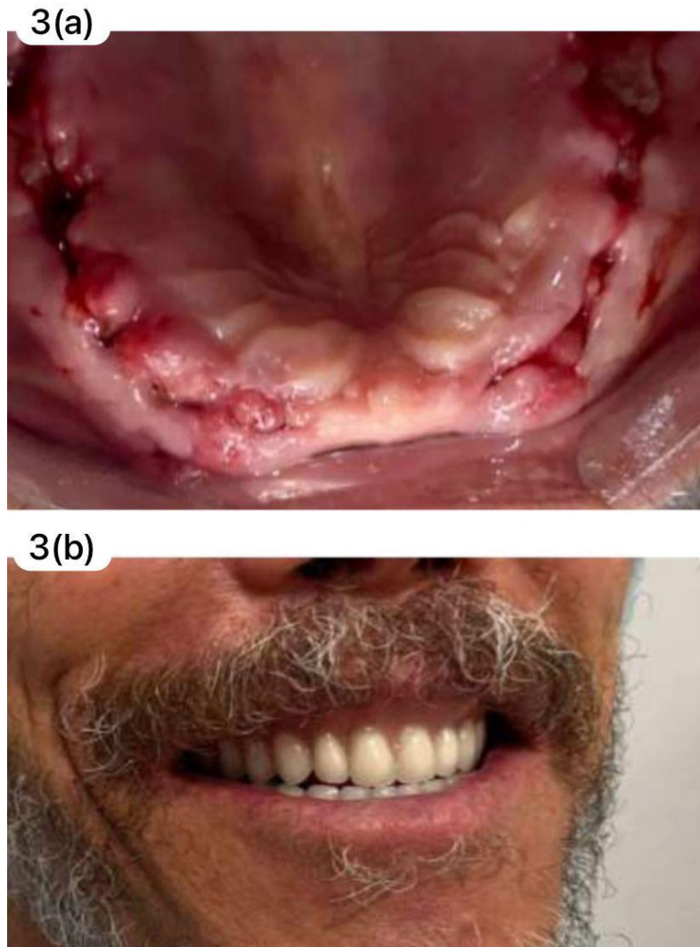
Figura 3(a) - Cicatrização do rebordo alveolar; Figura 3(b) - Paciente reabilitado 20 dias após extração