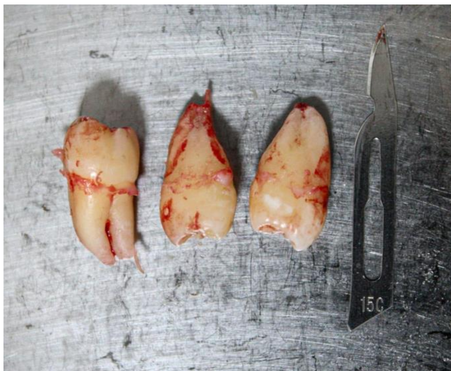
Figura 4 – Elementos 18, 28 e 48 pós-exodontia

As extrações foram conduzidas com uma incisão intrasulcular usando cabo de bisturi nº 3 (Quinelato) e lâmina 15c (Descarpack), seguida pelo descolamento do tecido com o Molt 2-4 (Fava), luxação dos dentes com uma alavanca reta (Fava) e, por fim, a exérese dos elementos (Figura 4) com fórceps 18R para o elemento 18, fórceps 18L para o elemento 28, e fórceps 17 para o elemento 38 (Quinelato). Não houve necessidade de realizar odontosecção ou osteotomia, e o procedimento transcorreu sem intercorrências. Após as extrações, as membranas de L-PRF foram inseridas nos respectivos alvéolos (Figura 5) e a sutura foi realizada nos alvéolos pela técnica em “X” com porta agulha Mayo Hegar (Golgran) e fio de Nylon 4.0 (Procure).