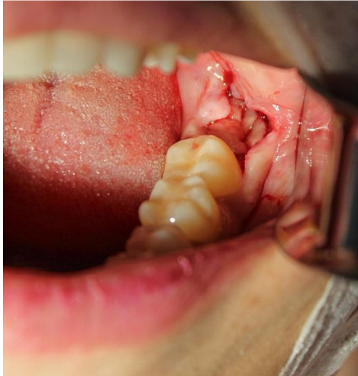
Figura 5 – Membrana de L-PRF inserido no alvéolo