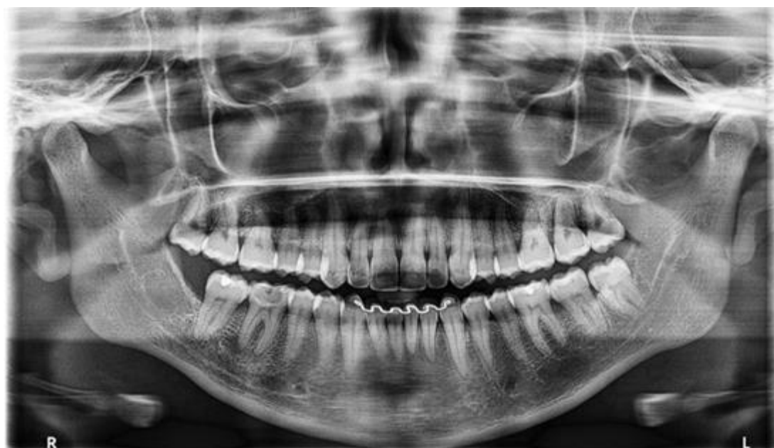
Figura 1 – Radiografia panorâmica

Foi selecionada uma paciente do sexo feminino, de 30 anos de idade, leucoderma, que compareceu à clínica odontológica buscando a extração de seus terceiros molares. Em seguida foi feita a anamnese, para avaliar-se o histórico de doenças sistêmicas ou alergias a medicamentos. A etapa seguinte foi a realização de uma radiografia panorâmica (Figura 1) na qual a partir dela foi elaborado um plano de tratamento que incluía a exodontia dos dentes 18, 28 e 38, que seria seguida pela aplicação do (L-PRF) nos alvéolos, visando proporcionar um período pós-operatório mais confortável para a paciente.