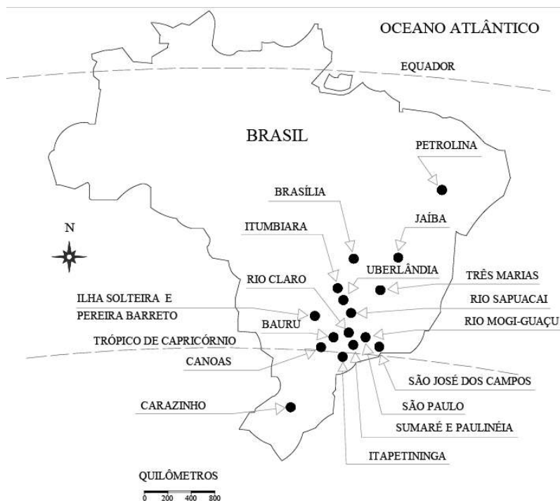
FIGURA 1 – Regiões brasileiras – solos colapsíveis