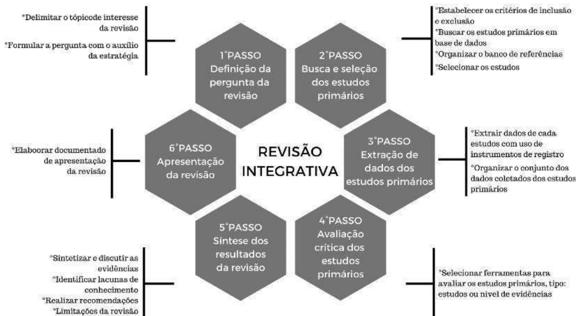
Figura 1: montagem de uma pesquisa integrativa