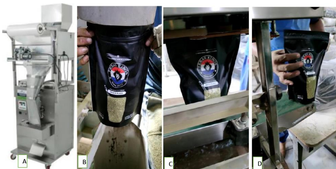
FIGURA 2 - Máquina embaladora e processo de empacotamento da erva-mate

A Figura 2 A apresenta o modelo de máquina embaladora utilizada pela empresa, e na sequência (Figura 2 B, C, D), o processo de empacotamento da erva-mate, a passagem pela esteira e a retirada do produto embalado pelo funcionário.