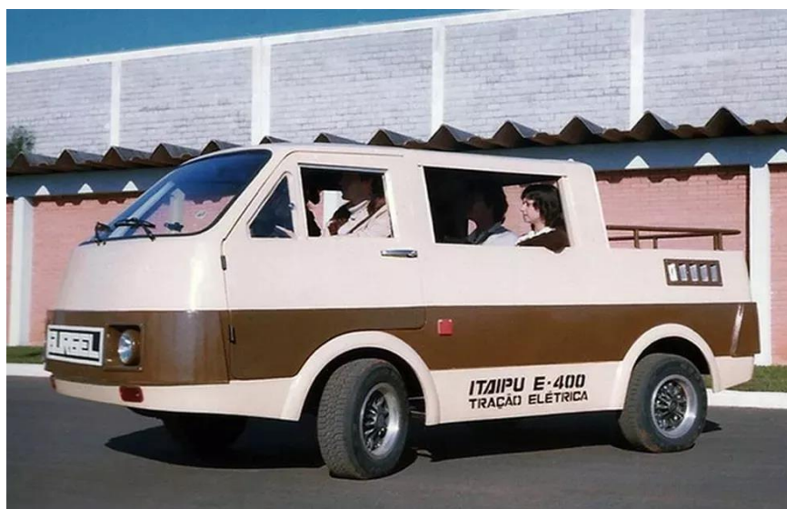
Figura 5: ITAIPU E-400 é o primeiro veículo elétrico produzido no Brasil.