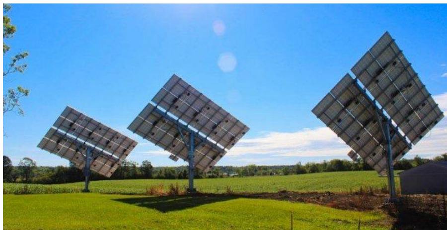
Figura 4: Modelo de instalação com sistema de rastreamento solar

BRASIL E A CORRIDA TECNOLÓGICA: O DESAFIO DOS CARROS ELÉTRICOS E A DISTRIBUIÇÃO DOS ELETROPOSTOS Eduardo de Camargo Marin, Annete Silva Faesarella