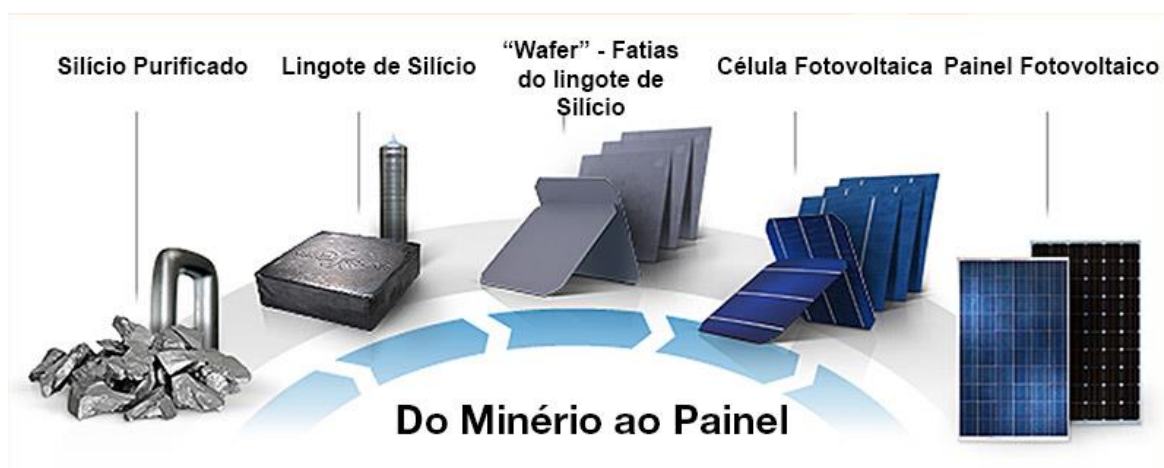
Figura 1: Processo de transformação do silício em placa fotovoltaica

Tratando-se das células fotovoltaicas, tem-se que o silício com símbolo Si, que é um semi metal do grupo do carbono e suas características químicas fazem a diferença na eficiência das placas, tendo como aspectos ou fatos de o componente químico ter mais facilidade de ceder elétrons, além de sua abundância no planeta, também tem um ponto de fusão de 1.414°C, sendo ele o escolhido para ser o minério principal na produção das placas fotovoltaicas. A figura 1 demonstra o processo da criação das placas fotovoltaicas (BLOG BLUESOL, 2020).