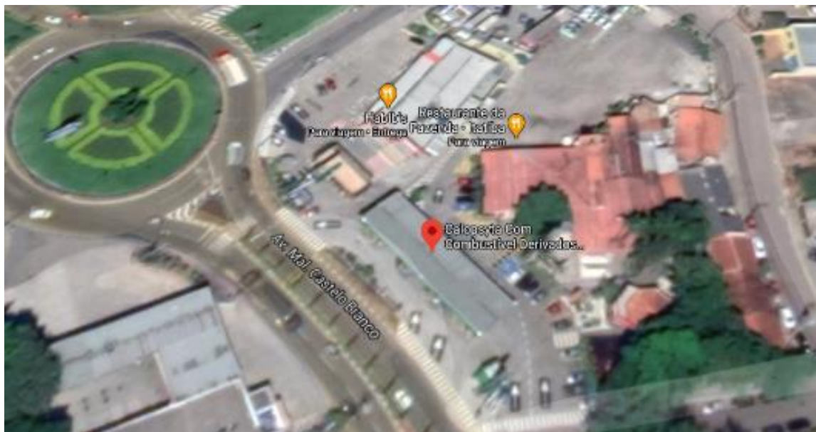
Figura 6 - Localização para a instalação do eletroposto, acoplado ao Posto de Gasolina Calopsita Ltda.

BRASIL E A CORRIDA TECNOLÓGICA: O DESAFIO DOS CARROS ELÉTRICOS E A DISTRIBUIÇÃO DOS ELETROPOSTOS Eduardo de Camargo Marin, Annete Silva Faesarella