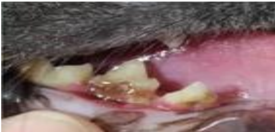
Figura 3 Exposição das raízes.