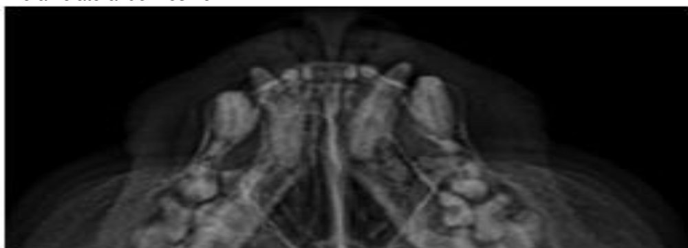
Figura 6 Radiopacidade adjacente à raiz do canino mandibular direito com deslocamento craniolateral do mesmo.