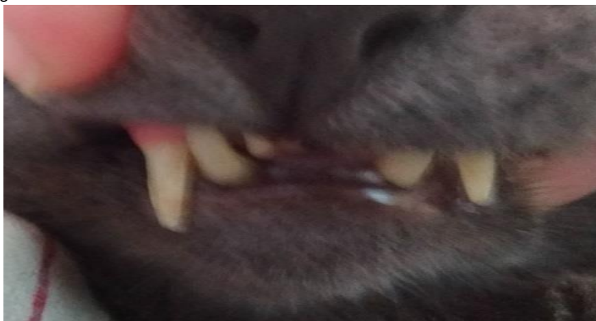
Figura 1 Extrusão de caninos direitos.

Foi atendido no Hospital Veterinário da Universidade de Campo Limpo Paulista (SP) no mês de novembro de 2019 um gato, macho, castrado, de 4 anos de idade, sem raça definida com 3,8 kg. O paciente apresentava halitose, extrusão do canino mandibular e maxilar direito, o que levou o tutor a acreditar que os dentes estavam crescendo anormalmente e procurar o hospital (Figura 1). O paciente foi submetido então a exame clínico, radiográfico e hemograma.