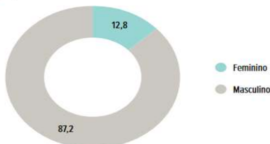
Gráfico 02 | Efetivo das Polícias Militares, por gênero (em %) Brasil - 2023