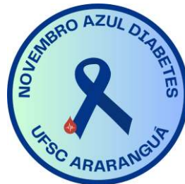
Figura 1 –Logotipo do Projeto Novembro Azul Diabetes

Para identificação do projeto na rede social, foi criada uma identidade visual para as publicações na forma de posts e vídeos educacionais. A identidade visual do projeto foi elaborada reunindo as principais características do trabalho realizado. O logotipo está demonstrado na Figura 1.