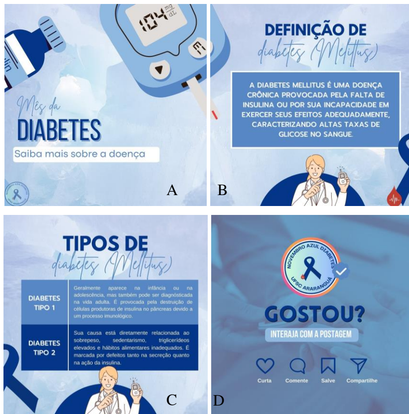
Figura 3 – Post em carrossel do perfil @diabetes.ufscararangua