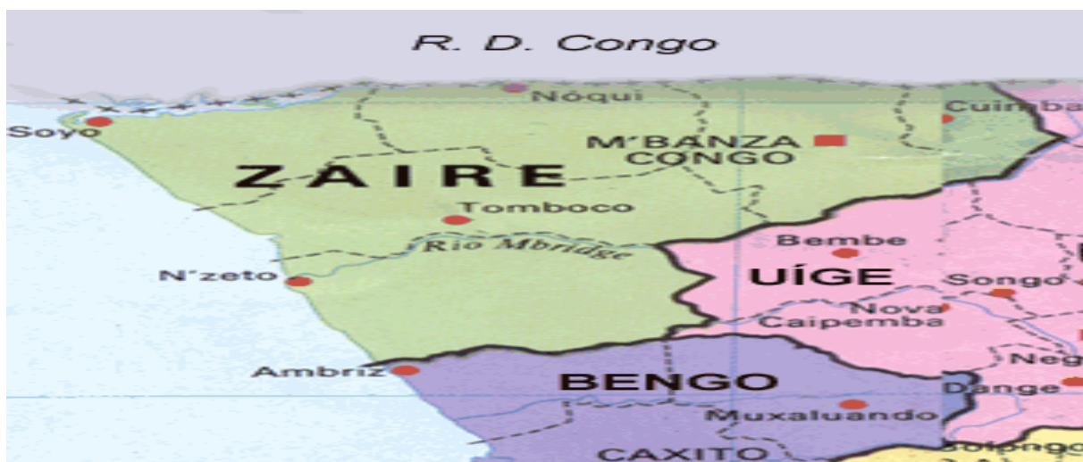
Figura 1: Mapa da província do Zaire (Angola)

Nota: Este mapa ilustra o município do Soyo banhado pelo oceano atlântico e o rio Zaire, ou seja, Congo river onde se localiza a cooperativa em estudo.