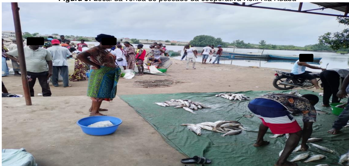
Figura 3: Local da venda do pescado da cooperativa Koxi Kia Kuaba

Nota: Esta imagem mostra o momento de comercialização do peixe e o tipo de embarcações usadas Adaptado: Autores, local da venda do pescado na cooperativa Koxi Kia Kuaba/Soyo