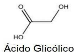
Figura 3 - Formula do ácido glicólico 9

Fonte 10 : Ferreira, E. de S., & Baiense, A. S. R. (2023). BENEFÍCIOS DO PEELING QUÍMICO COM ÁCIDO GLICÓLICO NO PROCESSO DE AMENIZAR O ENVELHECIMENTO DA PELE. Revista Ibero-Americana De Humanidades, Ciências E Educação , 9(4), 9555–9566. https://doi.org/10.51891/rease.v9i4.9863