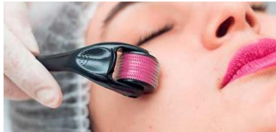
Microagulhamento com Dermalroller ( https://www.laiscarvalho.com.br/post/por-que-o-microagulhamento-funciona )

Alguns ativos utilizados são: ácido retinóico, vitamina C. Após o procedimento deve se utilizar tratamentos de uso diário como hidratante e protetor solar. (Bergmann; Silva, 2020).