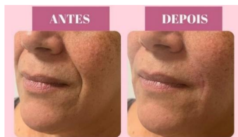
Antes e depois, preenchimento "bigode chinês" ( https://hamonir.com.br/preenchimento-bigode-chines/ )

Este procedimento permite o resgate do aspecto jovial da face, lembrando que devemos conscientizar a população a sempre procurar um profissional habilitado para tal função (Santarosa et al. , 2021).