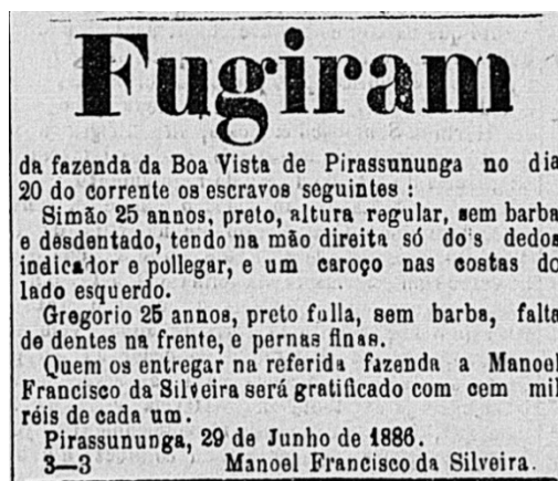
Figura 2. Anúncio de escravos fugitivos