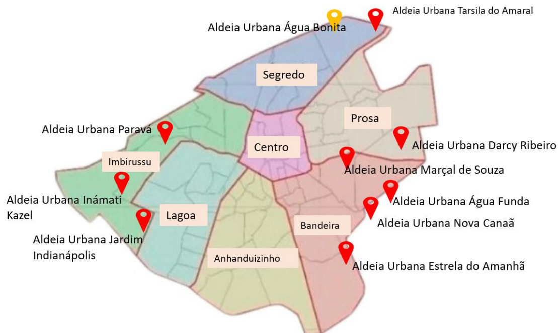
Figura 1. Localização das Aldeias Urbanas em Campo Grande/MS