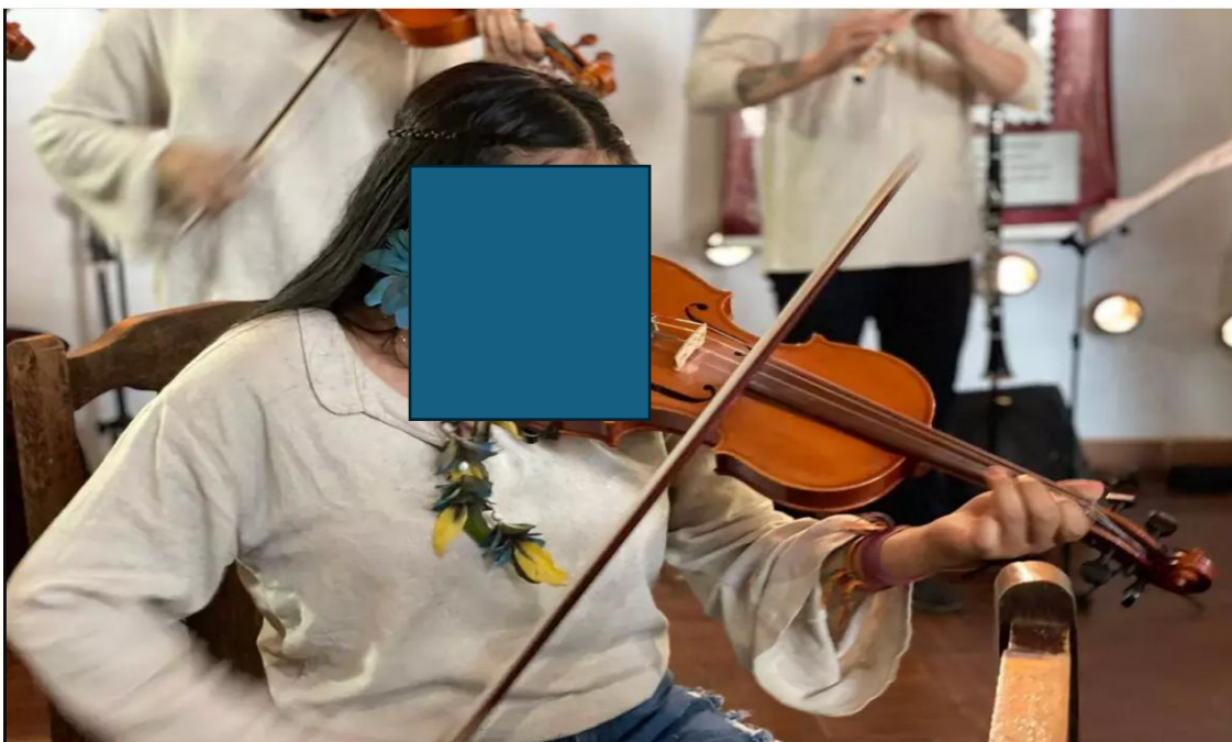
Figura 2. Adolescente recebendo as primeiras aulas de violino

A Orquestra Indígena destaca-se por ser o único grupo do tipo no Brasil focado em música de concerto. Com suas apresentações, a Orquestra Indígena busca difundir para o mundo a importância da preservação ambiental e a mensagem de que a cultura é um ponto fundamental de encontro e respeito entre todos os povos, na (figura 2) a adolescente recebendo as primeiras aulas.