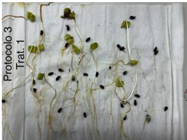
Figura 1. Segunda leitura do teste de germinação (aos 12 dias) de sementes de algodão ( Gossypium hirsutum L.) cv TMG 91 WS3 tratadas com 2,0 mL kg -1 Greener. Cuiabá/MT, 2024

Os produtos Greener e Stimulate aumentaram 5,5 e 12,5 pontos percentuais a porcentagem de germinação das sementes de algodão, respectivamente (Tabela 5). Observa-se nas Figuras 1, 2 e 3 as plântulas normais desenvolvidas entre a primeira e a segunda leitura do teste de germinação (na primeira leitura retirou-se as plântulas normais).