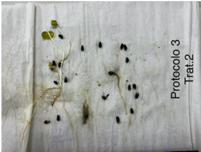
Figura 2. Segunda leitura do teste de germinação (aos 12 dias) de sementes de algodão ( Gossypium hirsutum L.) cv TMG 91 WS3 tratadas com 7,5 mL kg -1 , Stimulate. Cuiabá/MT, 2024